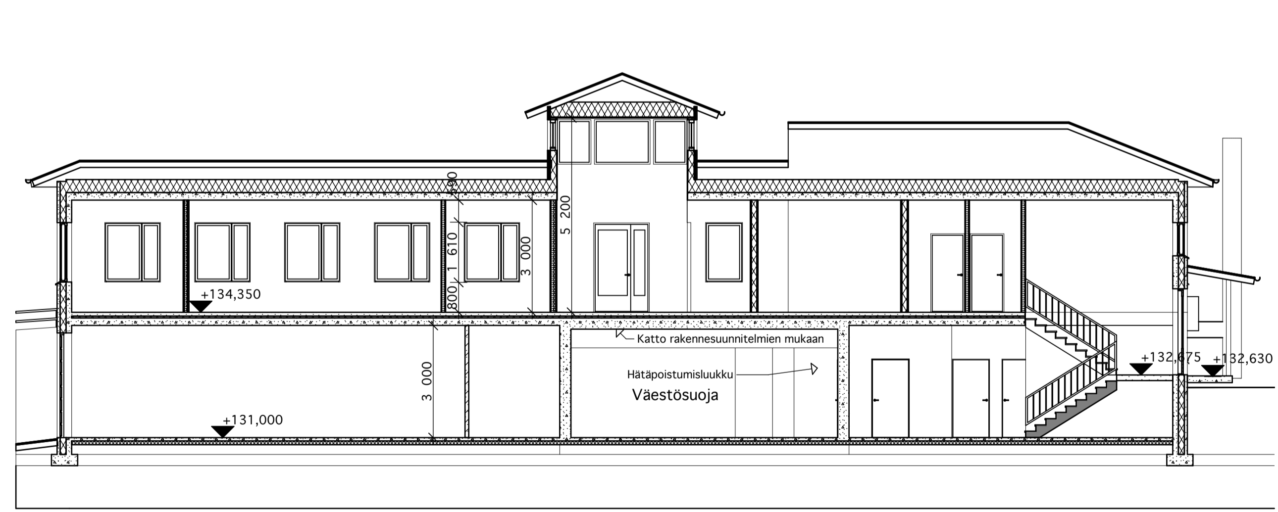
B Leikkaus B-B 1:100